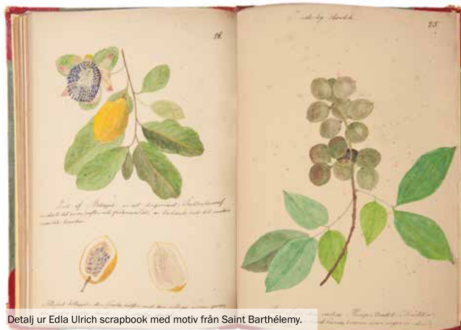
Detalj ur Edla Ulrich scrapbook med motiv från Saint Barthélemy.