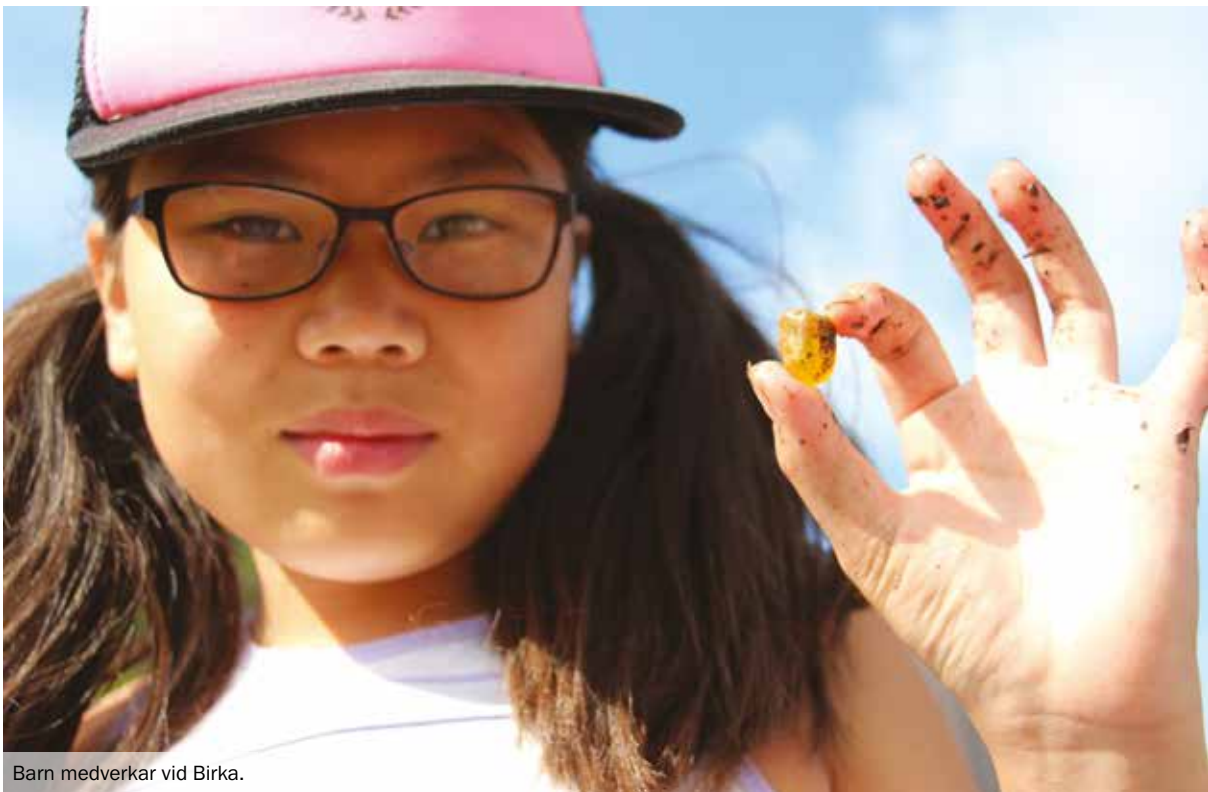
Barn medverkar vid Birka.