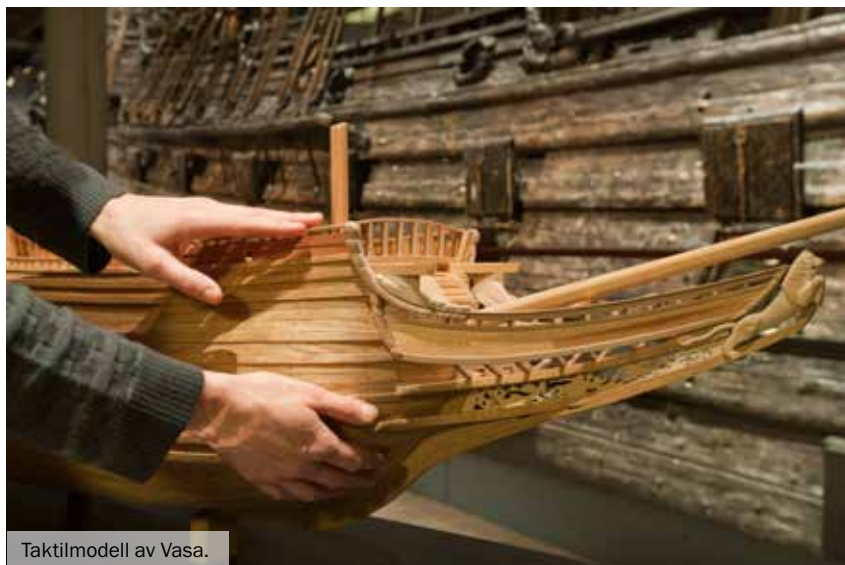
Taktilmodell av Vasa.

I allt vårt utställningsarbete tar vi genomgående hänsyn till både kognitiva och fysiska funktionsnedsättningar. Under året har Sjöhistoriska museets utställningar Klart skepp och Shipping & Shopping fått nyskrivna utställnings- och föremålstexter med förbättrad information och läsbarhet för målgrupperna. På Vasamuseet har vi påbörjat en liknande omarbetning av skeppshallens orienteringsskyltar. Sjöhistoriska museets källarplan har dessutom säkerhetsanpassats för personer med funktionshinder, bland annat genom säkra utrymningsplatser för rullstolsburna och visuellt utrymningslarm för hörselskadade.