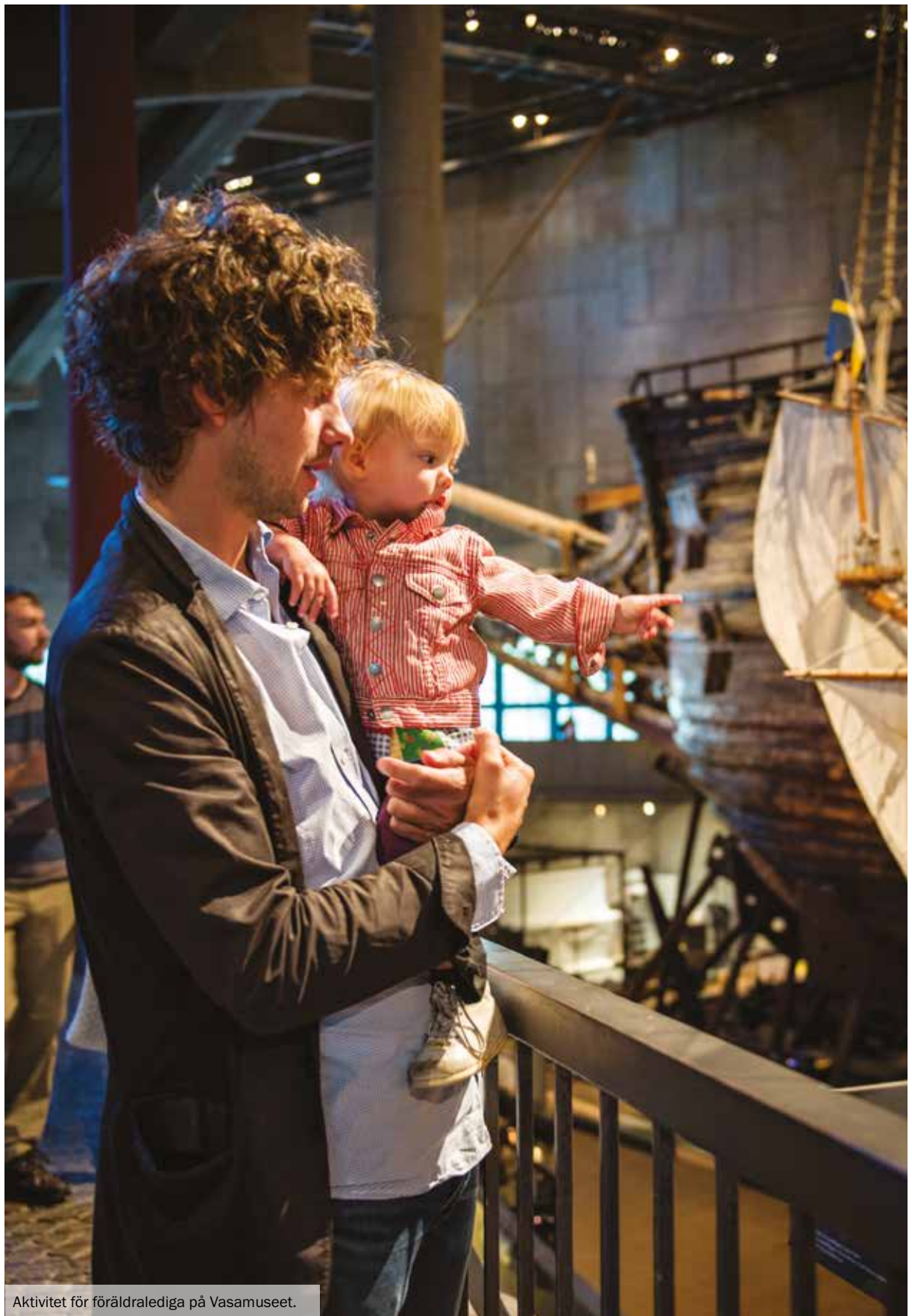
Aktivitet för föräldralediga på Vasamuseet.