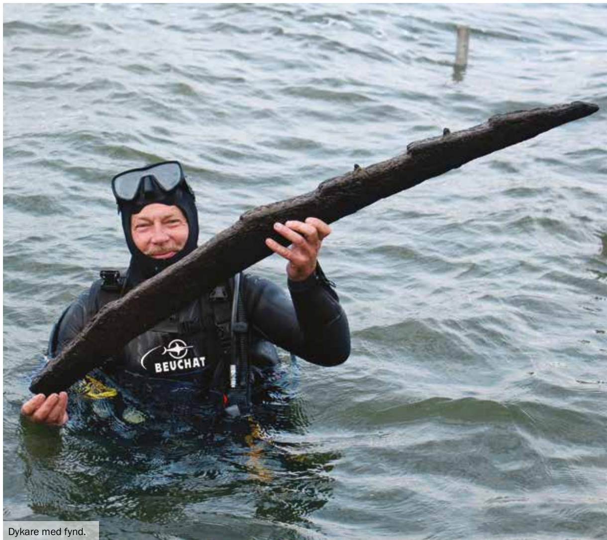
Dykare med fynd.

arna fokuserade på rådande lagstiftning, vård och bevarande av kulturarvet under vatten. Under hösten besiktigade vi ett fartyg för att söka efter narkotika tillsammans med Tullverket, Kustbevakningen och Sjöpolisens dykenhet. Vi har även deltagit i projektet Miljörisker sjunkna