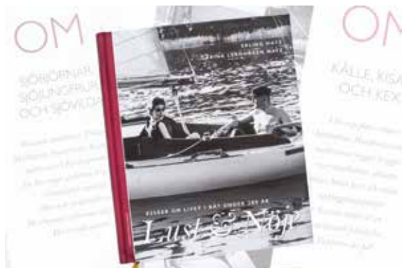
Sjöhistoriska museets årsbok 2014.