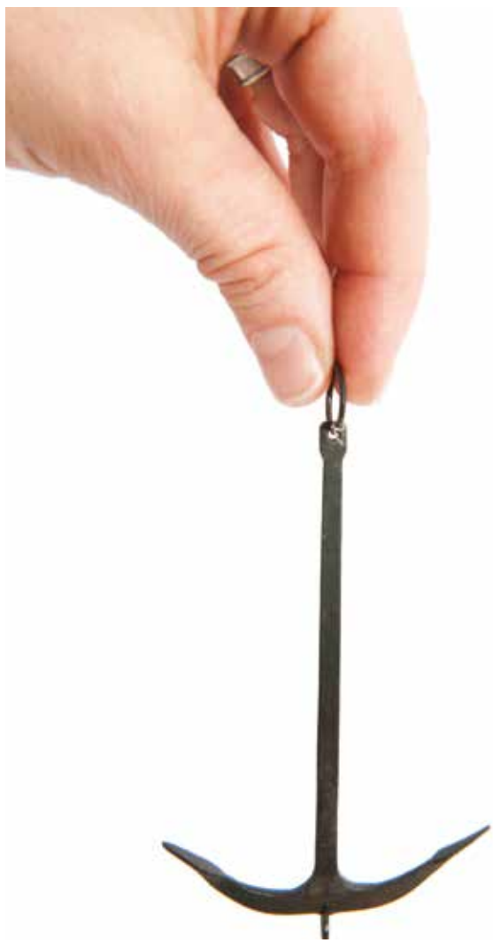
Modell av ankare från vikingaskeppet i Oseberg.