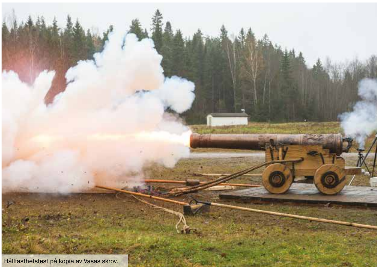
Hållfasthetstest på kopia av Vasas skrov.

forskare, studenter, museianställda och allmänt maritimt intresserade i Stockholm och Karlskrona. Under 2014 har 15 seminarier genomförts och två seniora forskare, två post.doc. och fyra doktorander har arbetat vid CEMAS. Vi har författat en lärobok i maritim historia på universitetsnivå, med publicering under 2015, och fungerat som gästredaktörer för Historisk Tidskrift 2014:3, med tema maritim historia.