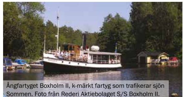
Ångfartyget Boxholm II, k-märkt fartyg som trafikerar sjön Sommen.

Genom så kallade Bareboat charteravtal bevaras och brukas ett antal av Statens maritima museers kulturhistoriskt intressanta fartyg av externa intressenter och ideella föreningar: minsveparen M20 , robotbåten R142 Ystad , båda med hemmahamn i Stockholm, samt torpedbåten T38 i Karlskrona. Upplägget är unikt i Museisverige och möjliggör en kulturhistorisk verksamhet med driftsatta fartyg som tar passagerare – något som varit omöjligt om fartygen varit mer ordinära museifartyg i myndighetens regi. Patrullbåten Hugin är dessutom en stillaliggande deposition vid Stiftelsen Göteborgs maritima center.