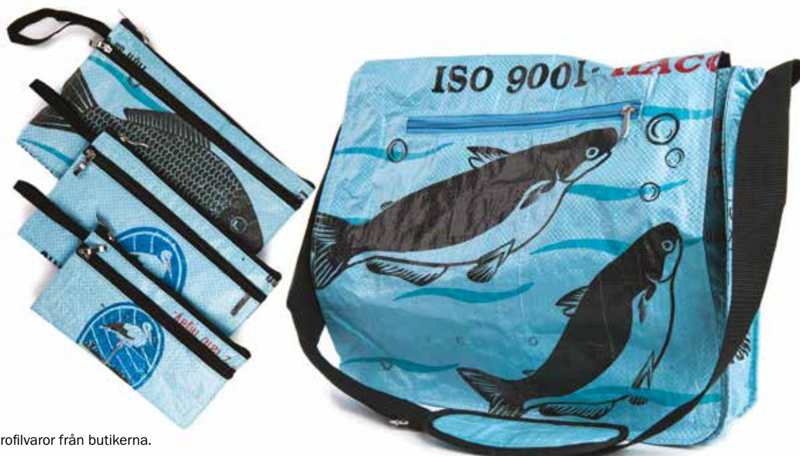
Miljöprofilvaror från butikerna.

Museibutikerna är en viktig del av museibesöket och museernas identitet gentemot besökaren. Både Vasamuseet och Sjöhistoriska museet har under året ökat sitt utbud av varor, framför allt av miljöprodukter. Under första halvåret 2014 färdigställdes en ny inredning i Marinmuseum's besöksmottagning, reception och butik. För medarbetarna har det medfört en förbättrad arbetsmiljö, framförallt vad gäller varuhantering och kassaplatser. I samband med den nya ubåtshallen har 27 ubåtsprodukter tagits fram för butiken, som är unika för museet. Parallellt med högre besöksiffror och ett utökat varusortiment på Marinmuseum steg butikens försäljning markant jämfört med 2013.