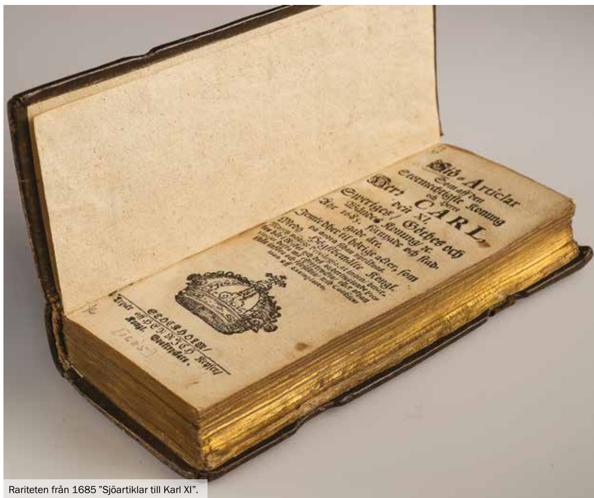
Rariteten från 1685 "Sjöartiklar till Karl XI".

Året har vi utökat museets fritidsbåtssamling med en väldokumenterad Plym-jolle med en intressant historia, bland annat har den tillhört konstnären Anders Zorn. Dessutom har IF-båten med nummer 1 insamlats som en del i ett större dokumentationsprojekt om fritidsbåtar i samarbete med Stockholms universitet. Biblioteket har införlivat ett stort antal böcker om marinmåleri. Vår bedömning är att Sjöhistoriska museet nu har landets förnämsta samling av litteratur om marint måleri.