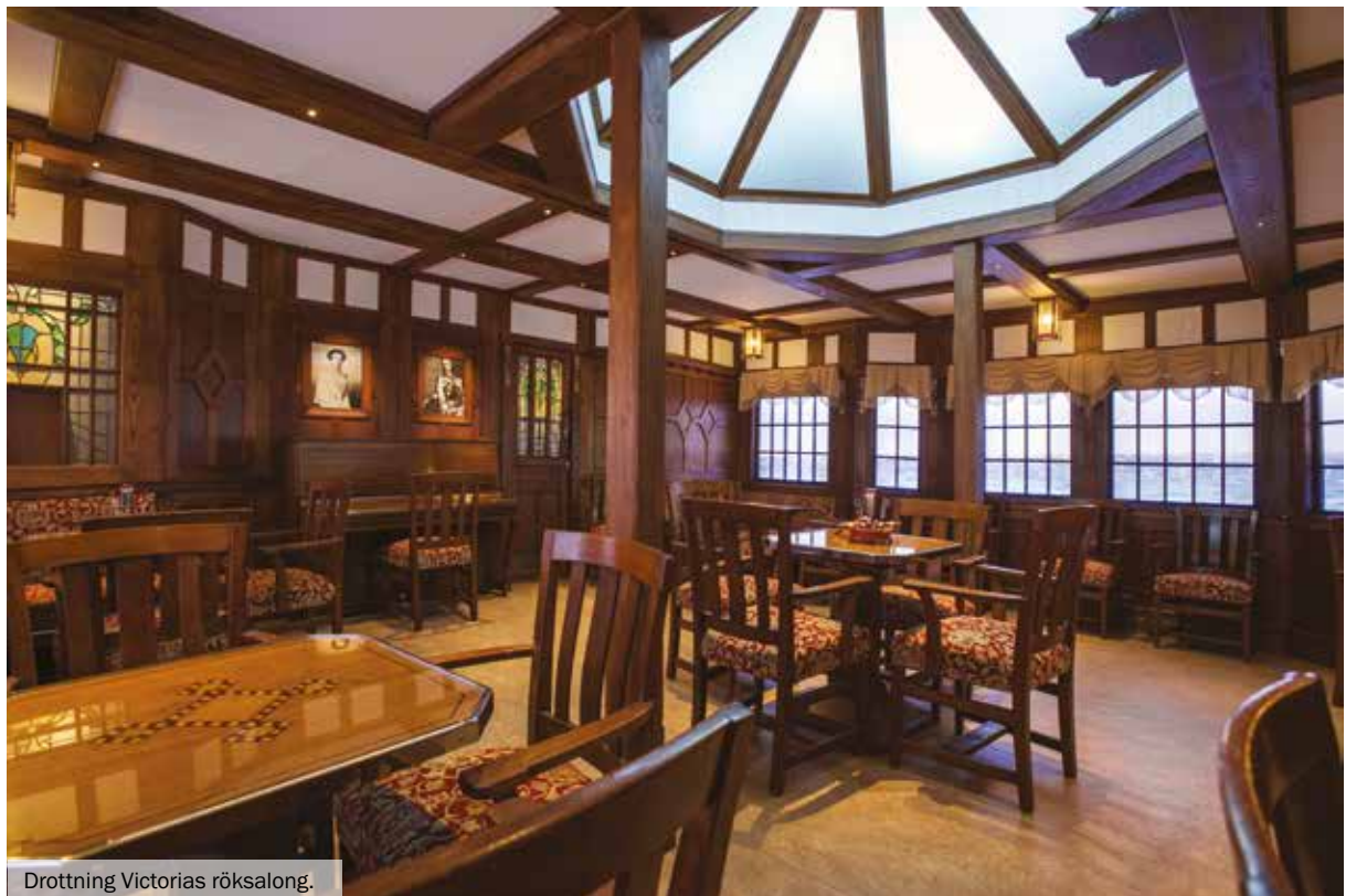
Drottning Victorias röksalong.