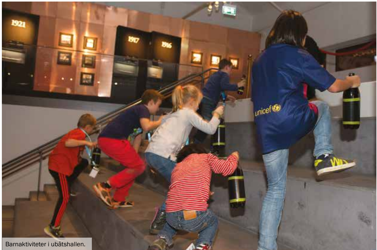
Barnaktiviteter i ubåtshallen.

Myndigheten har under året lånat ut föremål till museerna i Hangö i Finland, Seaplane Hangar vid Estlands sjöhistoriska museum i Tallin, samt till Landesmuseum Schleswig-Holstein i Schleswig. Vi har dessutom ingått partnerskap med Landesmuseum kring en utställning om det stora nordiska kriget.