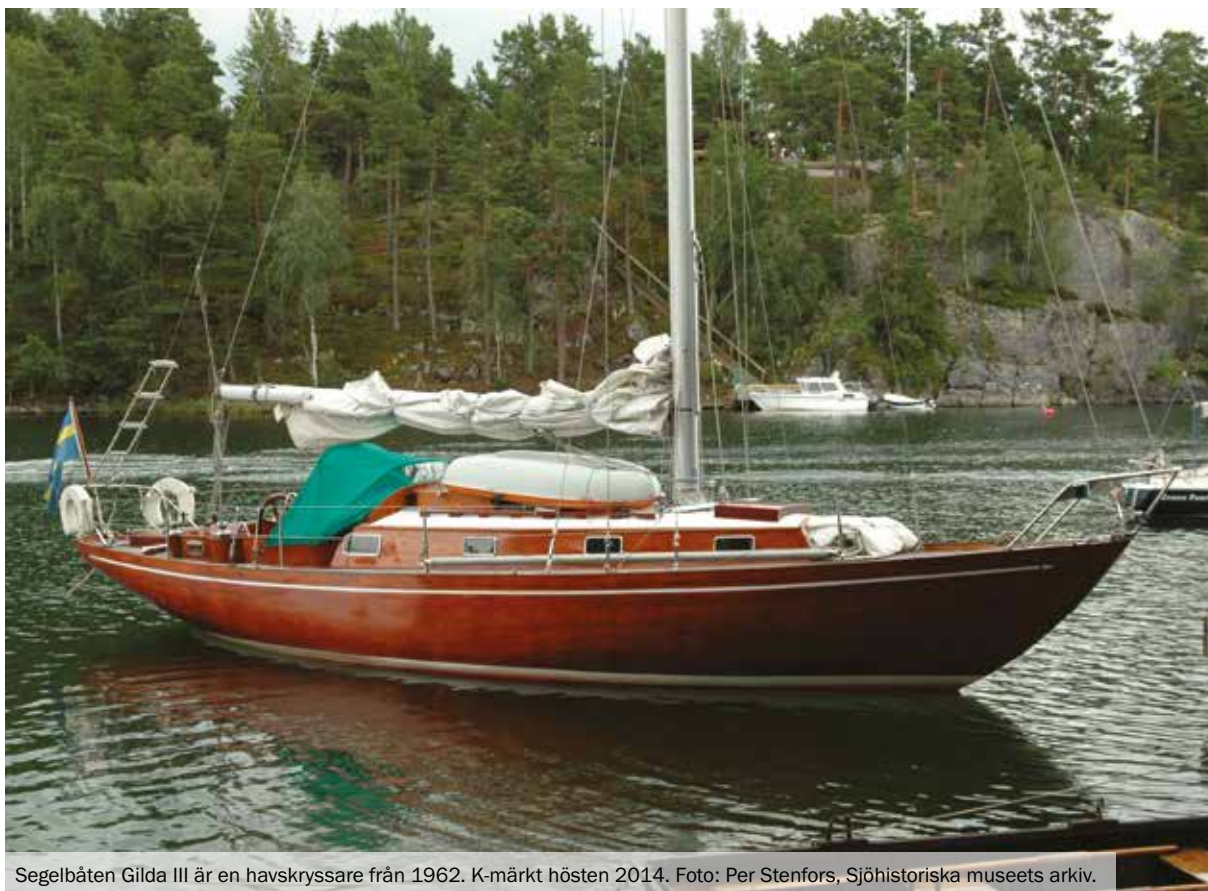
Segelbåten Gilda III är en havskryssare från 1962. K-märkt hösten 2014.